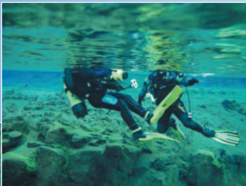
Till vänster: Deltaområdet. Obegränsad sikt, vit sand, blått vatten, limegröna växter.