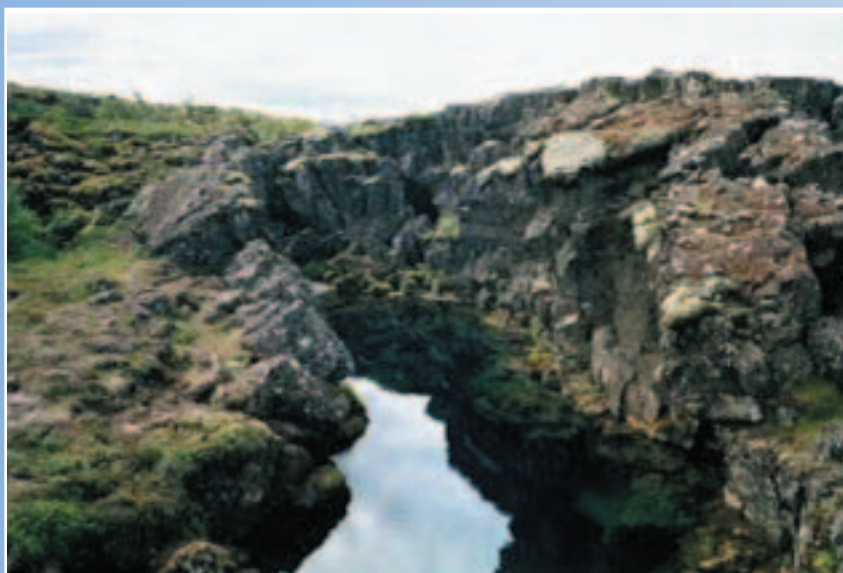
Ovan: Silfra från ytan - ser inte mycket ut för världen...

Telefon 08-545 215 60, fax 08-545 215 69, e-post Bryndis@islandia.se eller asta@islandia.se .