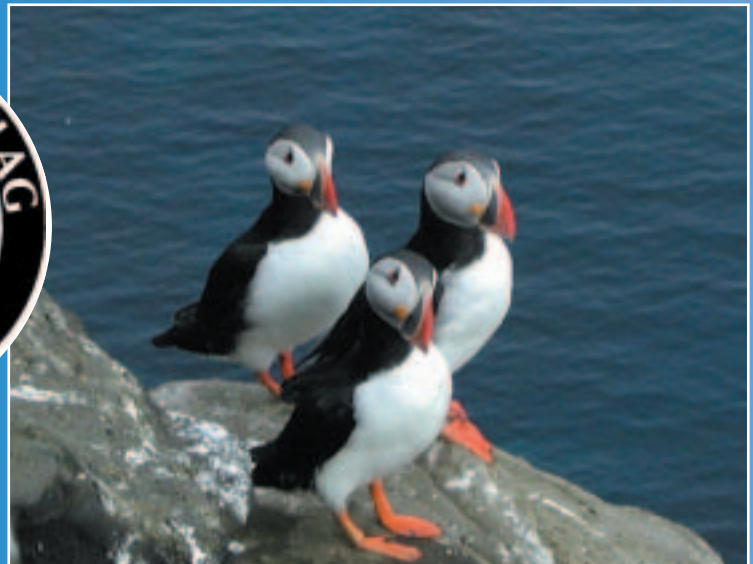
Till höger: Lunnefåglar på Drangey.

Bond-ön i ”vilken-film-det-nu-var”. Vi klättrade upp till den frodiga och gräsbevuxna toppen av ön efter första dyket och låg och tuggade på grässtrån, slappade, debriefade dyket och njöt av fika, bedårande utsikt och fågelskådning av guds nåde tills det var dags för nästa dyk. Härligt!