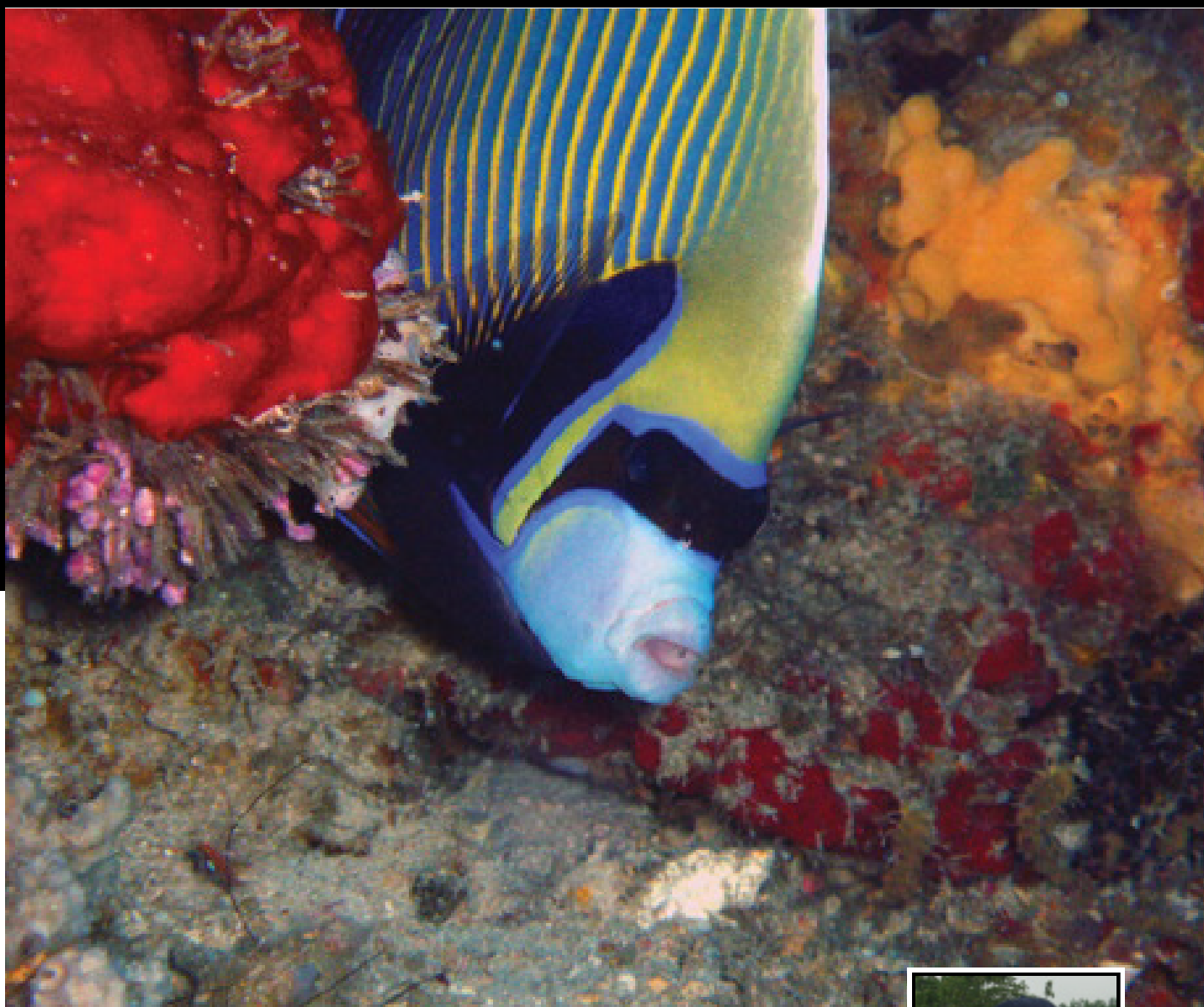
Ovan: Emperor angelfish