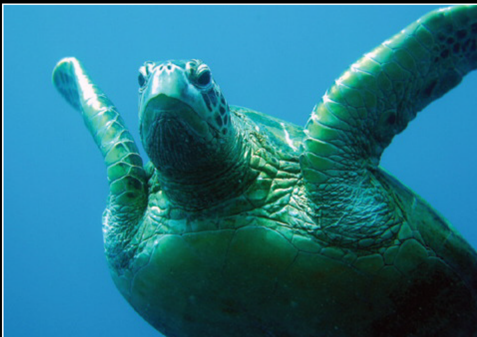
Till höger: Havssköldpaddor är ljuvliga

Divemastern knackade på tanken och när vi tittade ut i det blå såg vi två stora mantor som kom simmande mot oss.