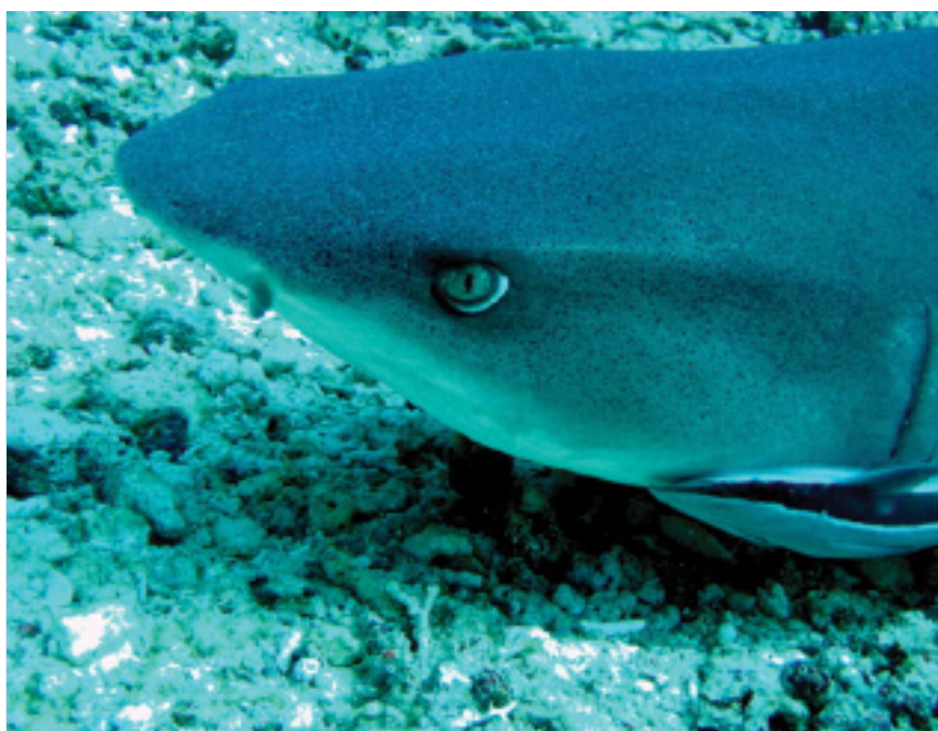
Till höger: Whitetipped reefshark på nära håll

Dag två var det första dyket på Barracuda Point. Där det vimlade det av haj och barracudor.