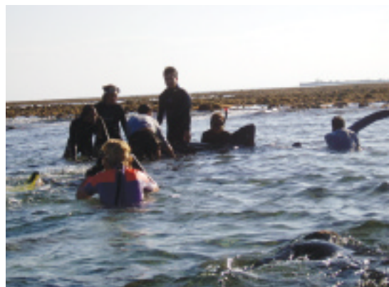
Ovan: Räddning av Valhaj