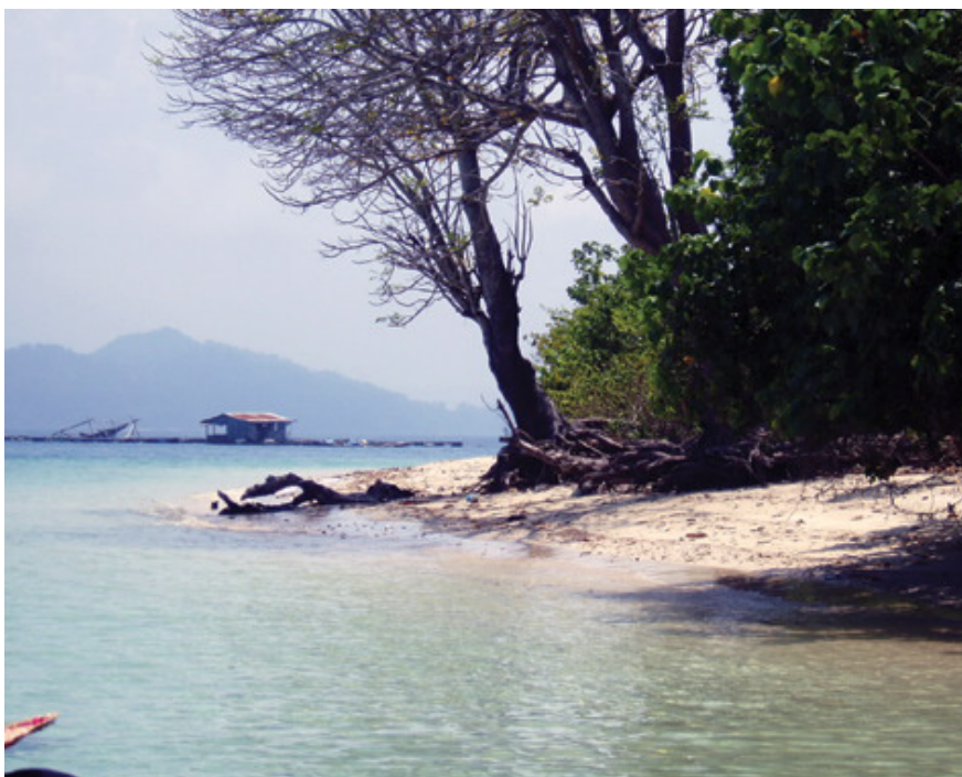
Till vänster: Paradisö