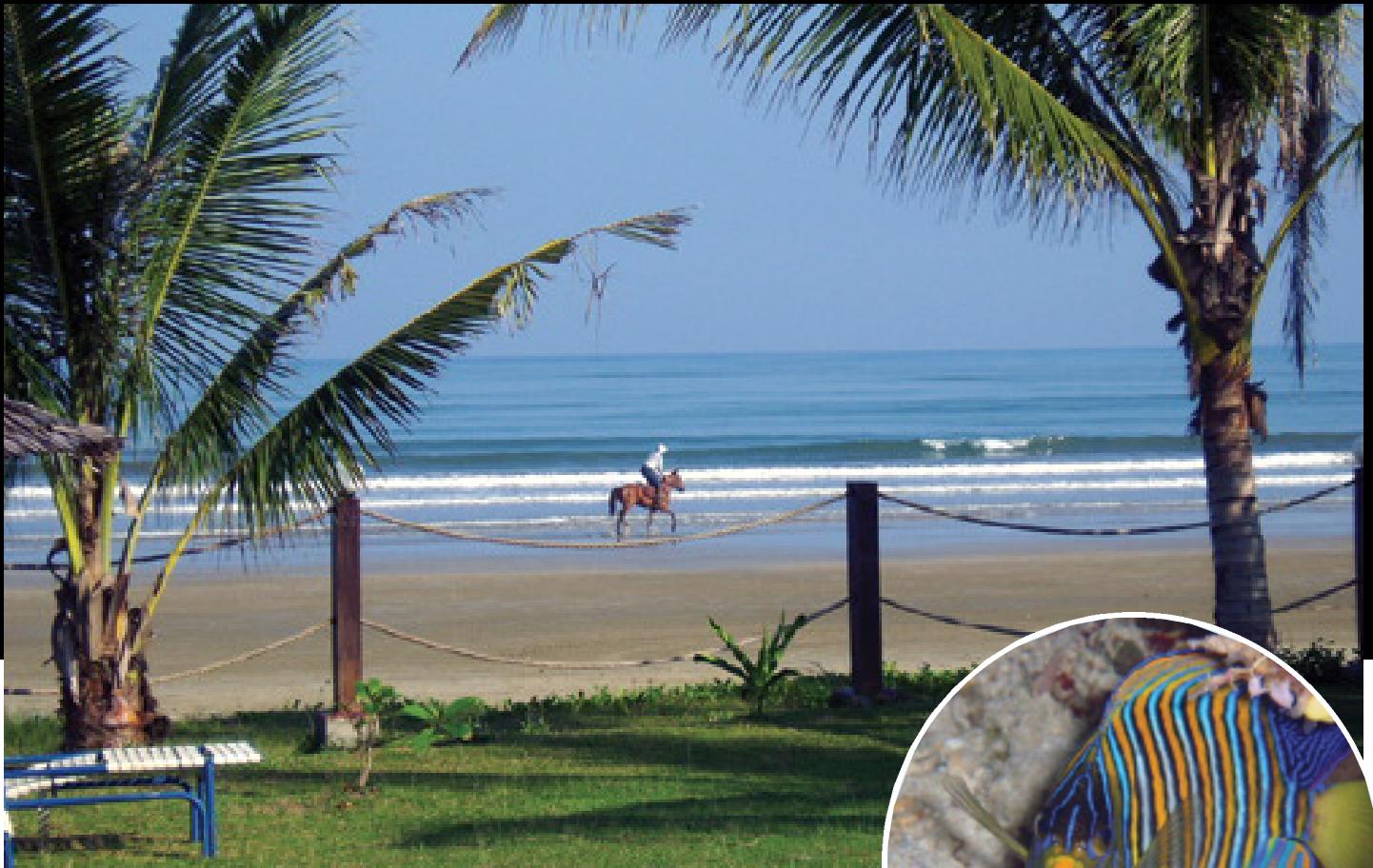
Ovan: Utsikt över stranden från restaurangen på Beringis Beach Resort