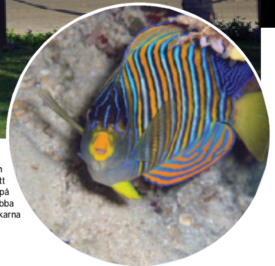
Till höger: Regal Angelfish Det är många kort tagna för att få detta. Det blir många kort på fiskrumpor först. De är så snabba att vända på sig de rackarna

> båten till Anilao och släppte av oss på Outrigger Resort. Där aktiverade vi oss med att åka Jeepney till närmaste stad för att kolla in läget. Efter en sen lunch kunde man ägna sig åt vattensporter, vattenskoter, Hobie-Cat, snorkling på husrevet. Ville man inte vara med så kunde man sitta på soldäck och betrakta cirkusen. Vi behövde övernatta och få rapa ur