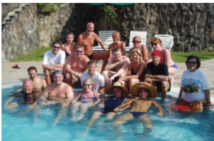
Gruppen vid poolen på Beringis Beach Resort, KK.