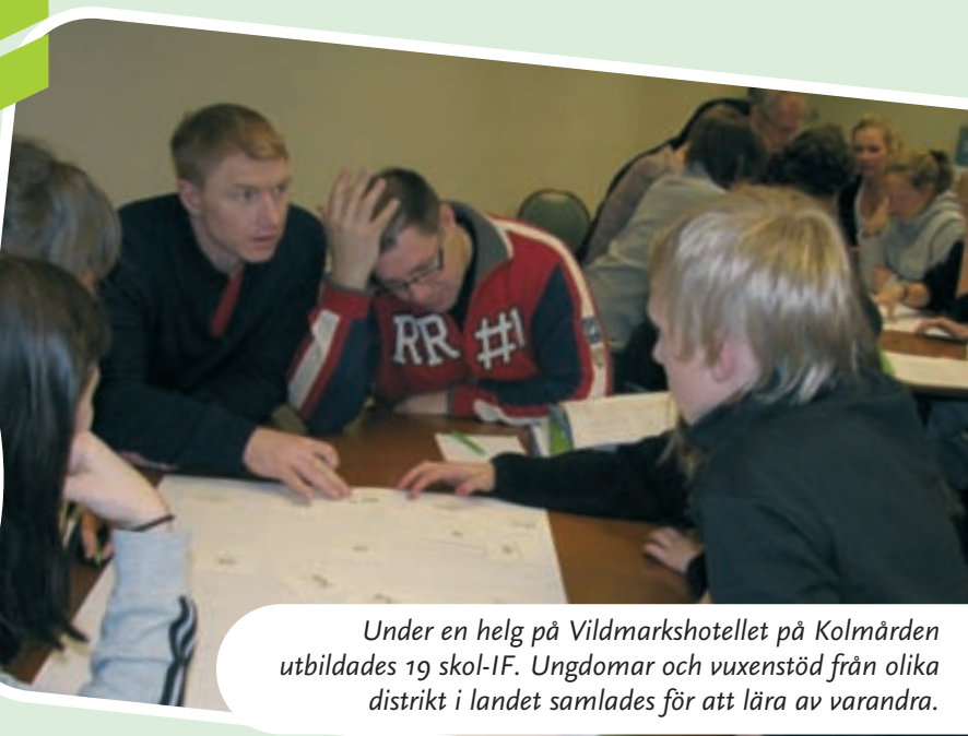
Under en helg på Vildmarkshotellet på Kolmården utbildades 19 skol-IF. Ungdomar och vuxenstöd från olika distrikt i landet samlades för att lära av varandra.