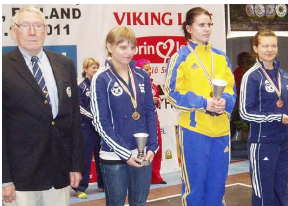
Prisutdelning för lättaste damgruppen U23NM, Pori.

* CC står för Club Championships och markerar lyftare som enbart deltar i Club Team Championships.