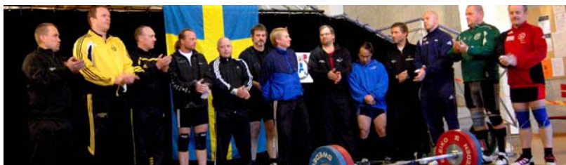
Line-up för de yngre veteranerna.