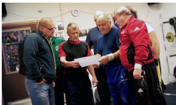
Taktiksnack i uppvärmningen.