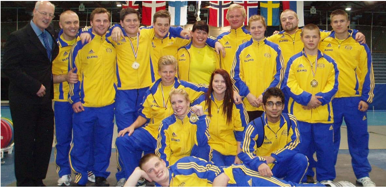
Svenska truppen som var och tävlade i Stavanger.