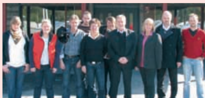
Styrelsen som valdes på förbundsmötet 2008.

Till förbundsmötet kan skolidrottsföreningar också motionera. Skol-IF:s styrelse kan alltså skicka in förslag på saker som de vill förändra eller nya saker som de vill införa i förbundet. Mer information om förbundsmötet och hur du gör för att nominera kandidater eller skicka in en motion hittar du på www.skolidrott.se . Välkommen med förslag!